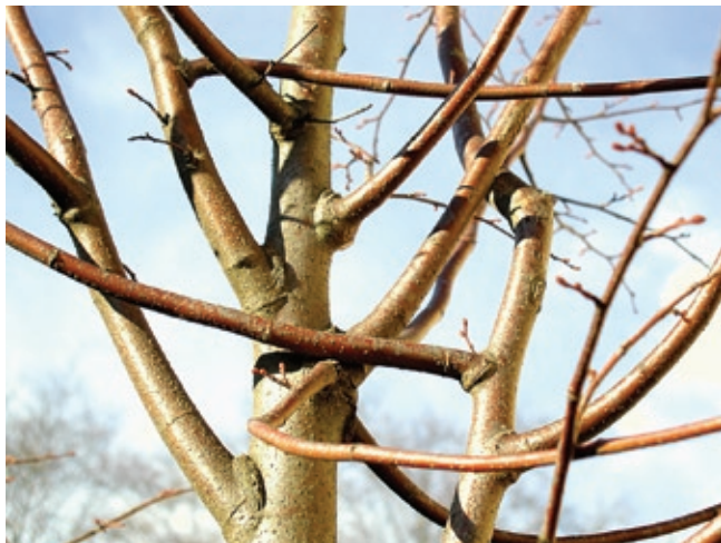
Reibende Äste: Hier ist fachgerechte Baumpflege erforderlich

Fachgerechter Kronenschnitt beseitigt unerwünschte Entwicklungen wie reibende Äste und fördert den Baum in seiner Entwicklung. Das Entfernen von stärkeren Ästen birgt immer die Gefahr, dass Holz zersetzende Pilze eindringen und den Baum langfristig schädigen.